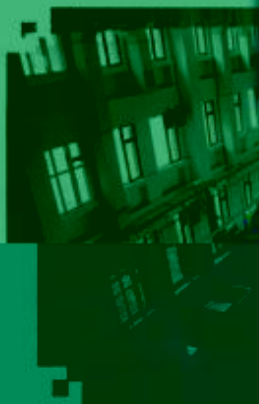
CNC 数控技术 训练场所